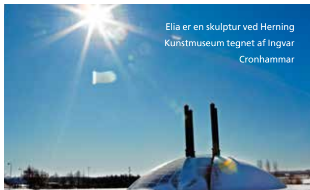
Elia er en skulptur ved Herning Kunstmuseum tegnet af Ingvar Cronhammar

Det er godt at komme et sted, hvor man bliver forstået.