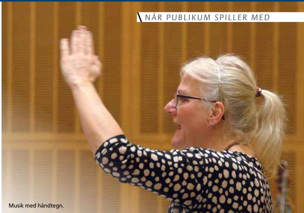
Musik med håndtegn.

Det væltede ind med tilmeldinger til Publikumsorkestret efter det første nyhedsbrev – og alle tilmeldte fik lov til at starte.