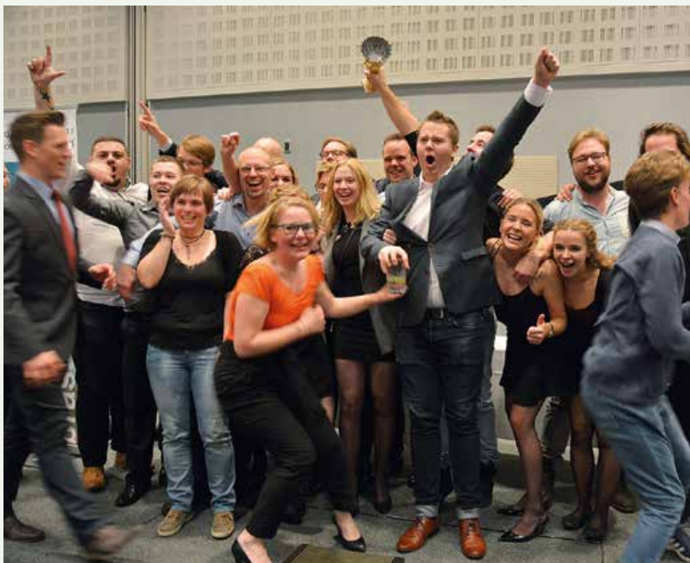
Jublen var stor da Lyngby-Taarbæk Brass Band blev dette års vindere af DM Brass 2015.