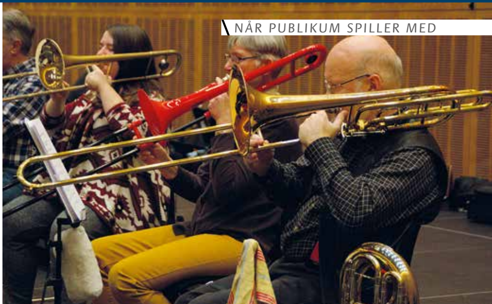
NÅR PUBLIKUM SPILLER MED

Normalt ser man ikke så mange røde plasticbasuner til prøverne i Operaen – men instrumentet egner sig fremragende til begyndere.