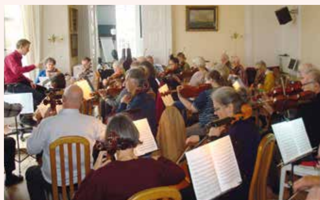
Strygerstævne i Helsingør Vandrerhjem.

Program og tilmelding kommer på www.daos.dk .