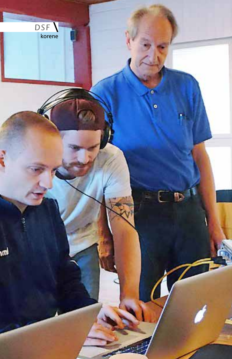
Optagelserne overføres til pc