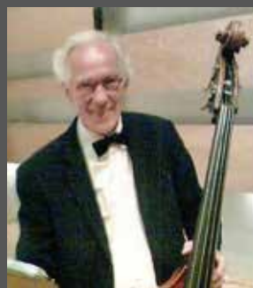
Helmer med bassen

Nærmere oplysninger vil komme på www.daos.dk