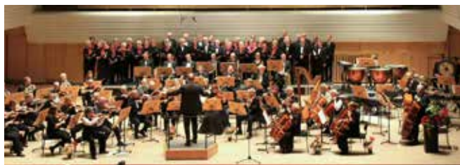
SASO i koncertsalen Alsion