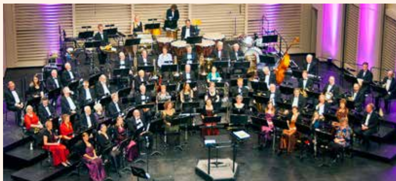
Harmoniorkestet TONICA på scenen i Musikhuset.

Der var noget for enhver smag, da Harmoniorkestet TONICA første søndag i januar spillede nytårskoncert for næsten fuldt hus i Store sal i Musikhuset Aarhus.