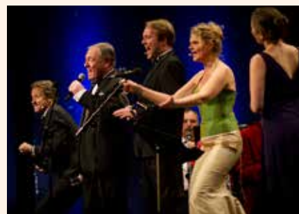
Medvirkende solister åbner Champagnen ved Greve Harmoniorkesters nytårskoncert i Potalen.