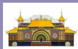
Tivoli Tegning af Hans Hansen