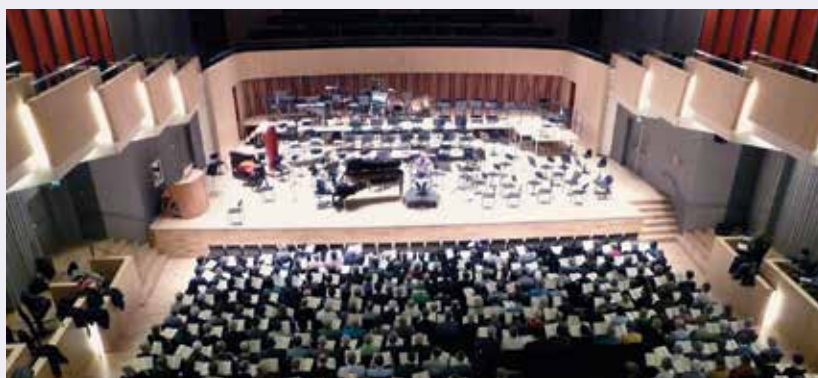
Fra Mozarts Requiem

Projektet er tænkt til at kunne rumme mange korsangere, men deltagelse er naturligvis altid under hensyntagen til balancen i stemmefordeling, samt pladsforhold.