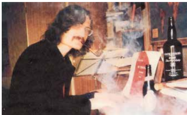
Ung mand fra 70'erne.