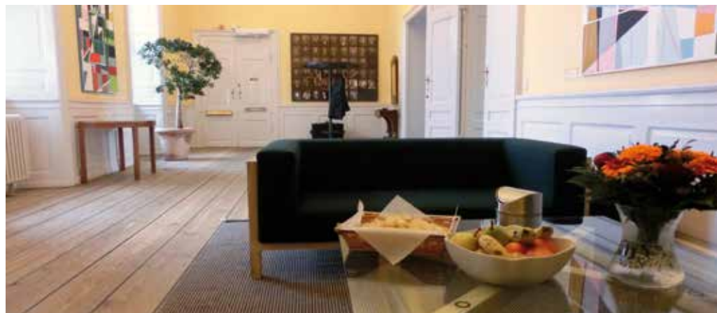
Hyggeligt venteværelse med kunst, frugt og 'ane-billeder' på bagvægge.

forskellige interesser blandt børnene. Udgangspunktet er, at eleverne får flere og bedre timer.