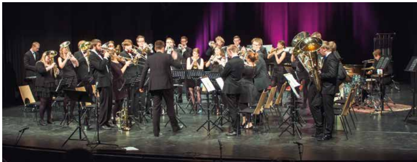
Silkeborg Blæserne.

Derudover er det også vigtigt med en klar artikulation. Hvis vi altid sørger for at spille med den samme artikulation i bandet, har vi det samme udgangspunkt. Det vil lynhurtigt hjælpe på intonationen.