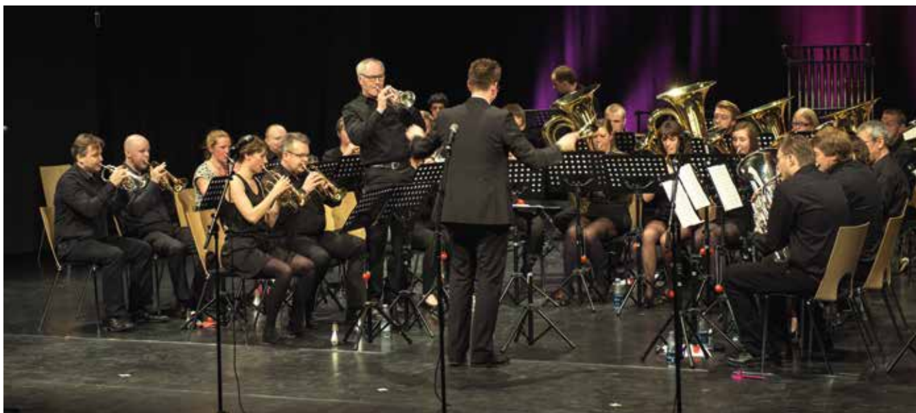
Skanderborg Brass Band.