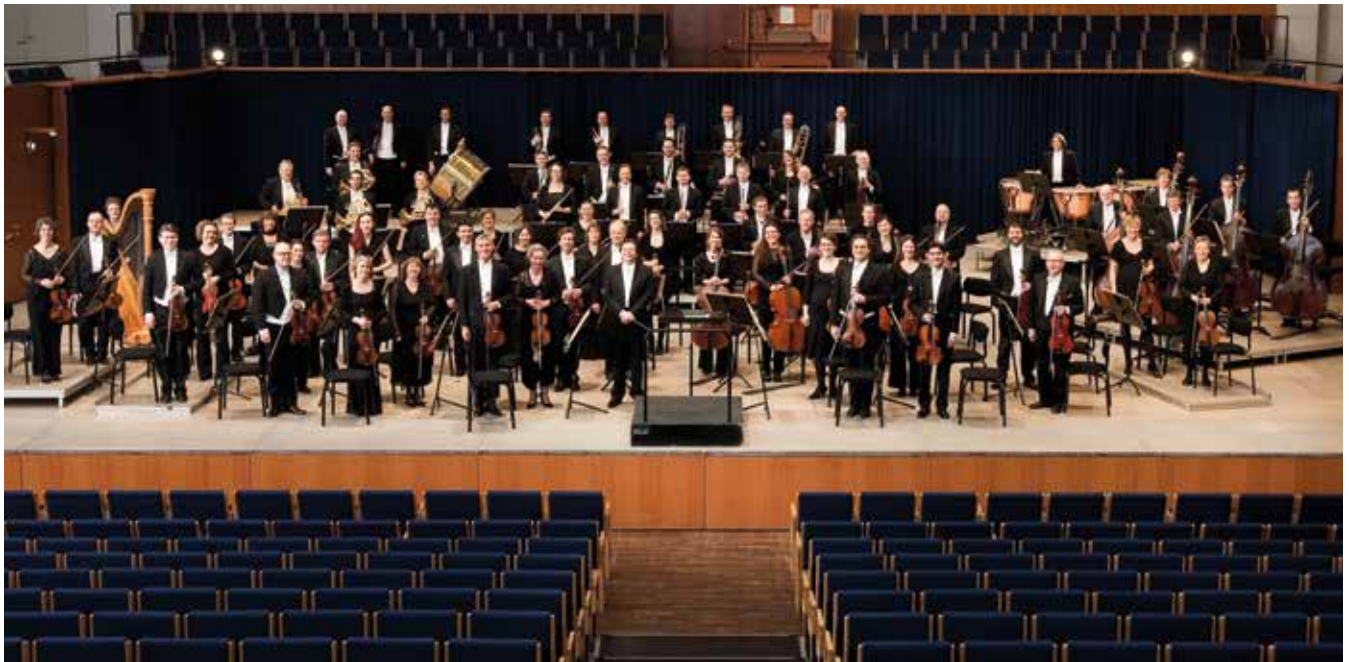
Odense Symfoniorkester i fuldt udtræk på scenen i Carl Nielsen Salen.