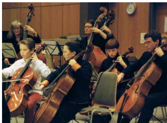
Musikskoleelever fra Rudersdal og omegn spillede sammen med Amatørsymfonikerne i Gades Ossián-ouverture ved orkesterets koncerter 19. og 20. marts.

Deltagelse er gratis, men der er begrænset antal pladser. Besked om plads gives senest 15. maj. Skriv gerne i tilmeldingsmailen, hvis I er flere, der ønsker at følges. Der vil ved tildeling af pladser blive taget hensyn til fordelingen af workshopdeltagere efter funktion, orkestertype, alder og andre forhold.