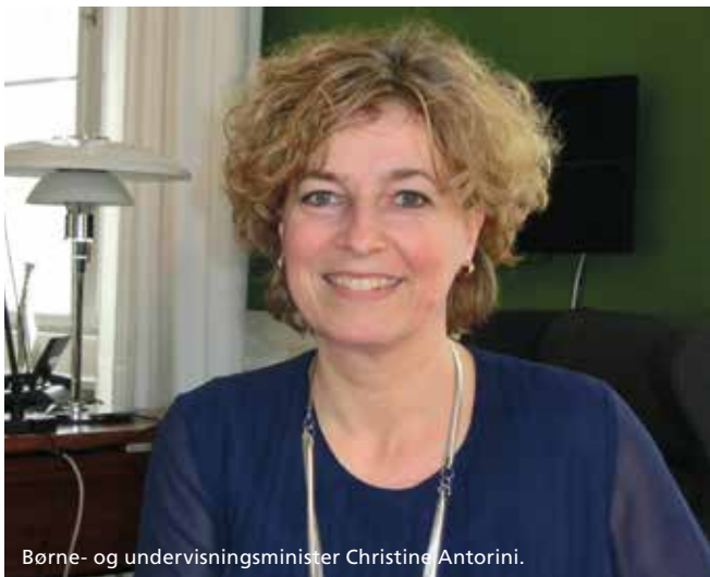
Børne- og undervisningsminister Christine Antorini.

Christine Antorini fortsætter: – Fritidsaktiviteter kan være en del af af denne helhedsskole, vekslede med undervisningsaktiviteter, blot det hele understøtter hinanden. Vi drøfter, at der kan være aftaler mellem skoler og omverdenen, således at man kan gå ud og ind af skolen i forbindelse med aktiviteterne. Det er meningen. Det skal være fleksibelt, fordi der er mange