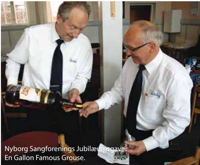
Nyborg Sangforenings Jubilæumsgave: En Gallon Famous Grouse.

2009/2010 og var så begyndt på øvningen. Ribe-sangerne tog som nævnt den første hårde tårn med stykket på en kor-week-end – et arbejde, der lønnede sig, da sangerne på kort tid fik en god fornemmelse af stykkets karakter.