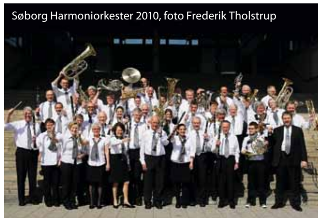
Søborg Harmoniorkester 2010

I 2011 fejrer Søborg Harmoniorkester igen et jubilæum – idet orkestret selv fylder 80 år.