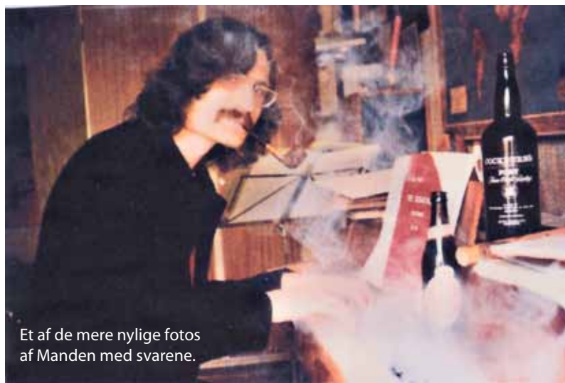
Et af de mere nylige fotos af Manden med svarene.