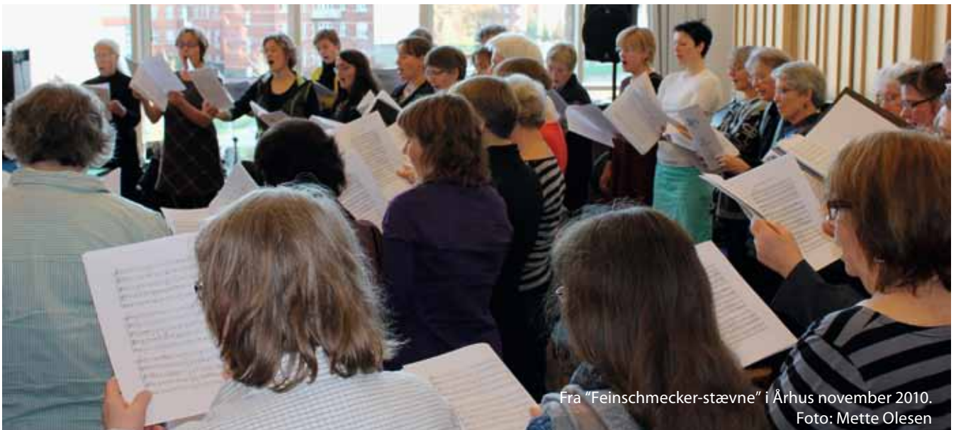
Fra "Feinschmecker-stævne" i Århus november 2010.