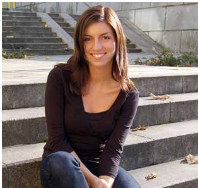
Instruktør: Line Groth

Line blev for mange "kendt" på Sommerstævnet 2009, hvor hun ledede U-gruppen. Med hendes entusiasme, utrolige musikalitet, opfindsomhed og ihærdighed, kan B-gruppen kun blive sommerens hit!